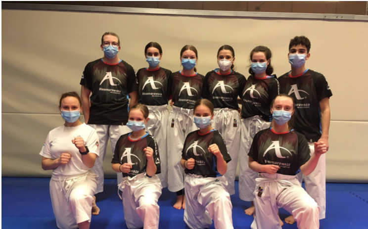
neue Arawaza T-Shirts für die Kata-Athleten