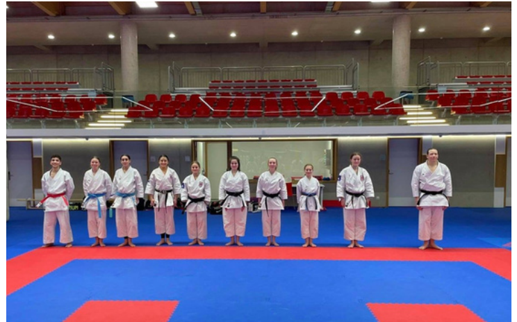
Unsere KATA-Athleten in der Nationalhalle beim Training