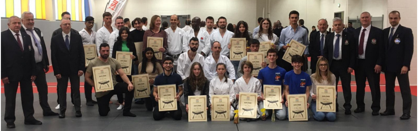
Certificate handover of the 2021 examinees