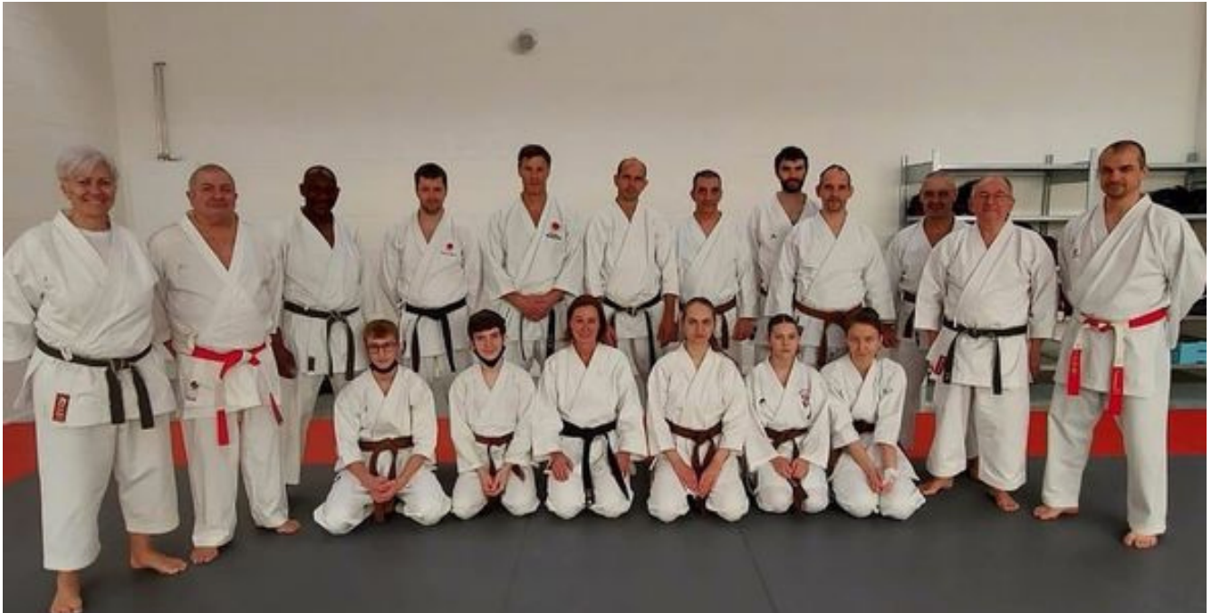
Preparatory course for the belt examination (1. - 4. DAN)