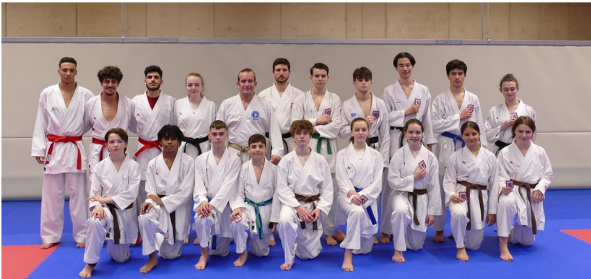
The new Kumite athletes in the national team. Welcome!